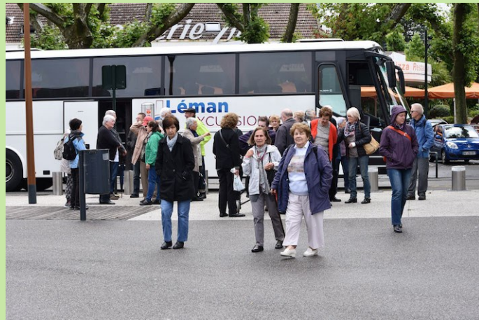
Excursion Lac du Bourget / Canal de Savières / 16 juin 2016